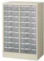
ルーミーケース (2列9段)