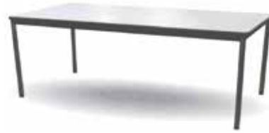
ホワイトテーブル

W1200×D750×H700 W1500×D750×H700 W1800×D750×H700 W1800×D750×H900