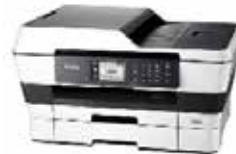
インクジェット プリンター