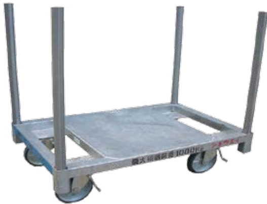
(オプション：単管パイプ)