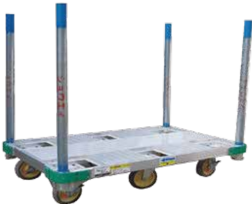
(オプション：単管パイプ)