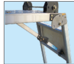
プレス材のロックを しっかり固定