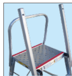
上枠・手がかり棒・赤滑り止めモールで 昇降時・作業時の安全を確保