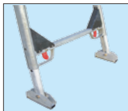
大きなスベリ止めで ガタツキを軽減